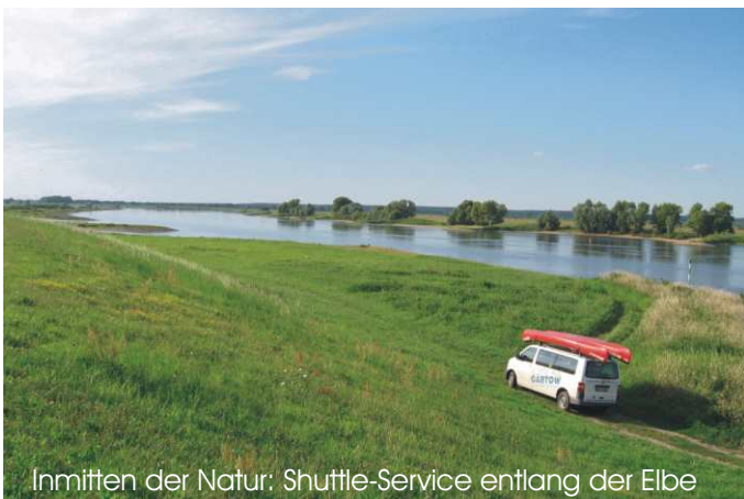
Inmitten der Natur: Shuttle-Service entlang der Elbe

4 Fahrräder samt Gepäck im Tausch gegen 2 ausgerüstete Boote können wir zumeist kurzfristig organisieren. Für größere Gruppen melden Sie sich möglichst früh vorab. Sie sagen uns, ab wo Sie auf das Wasser möchten und wir treffen uns dort nach Verabredung. Empfehlenswert ist der Abschnitt zwischen Wahrenberg (Elbcafé) und Höhbeck (27 Kilometer = Ganztagestour). Für 4 Personen kostet das Paddel+Pedale-Paket dann EUR 85,00 (inkl. Transfer und 2 Kanadier). Info und Reservierung: Stefan Reinsch per E-Mail stefan.reinsch@pevestorf.de oder Telefon unter 0 58 46 - 98 03 66